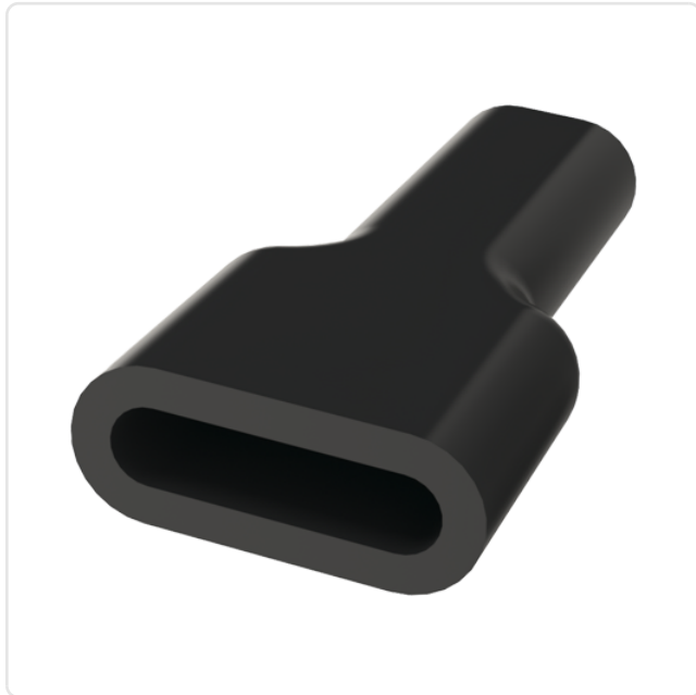
Abbildung ggf. ähnlich

Farbe: schwarz Isolation: PVC Länge [mm]: 25 Material: PVC - Polyvinylchlorid Materialgruppe: Kunststoff Gewicht: 0.57g Konformitäten: