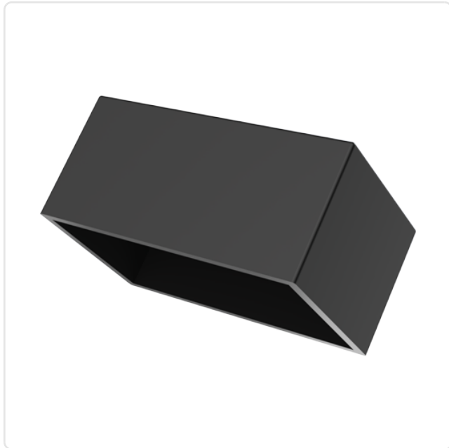
Abbildung ggf. ähnlich