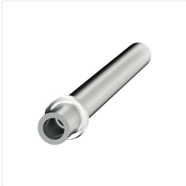
Abbildung ggf. ähnlich

Bohrung Leiterplatte [mm]: 1.3 Durchmesser [mm]: 1.2 Länge [mm]: 9 Material: Messing Oberfläche: verzinkt Stecklänge [mm]: 6.5 Wandstärke [mm]: 0,25 Gewicht: 0.06g Konformitäten: