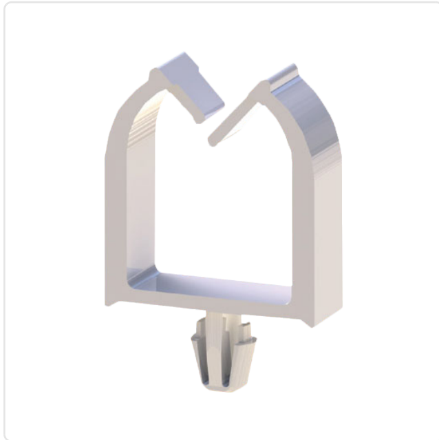
Abbildung ggf. ähnlich