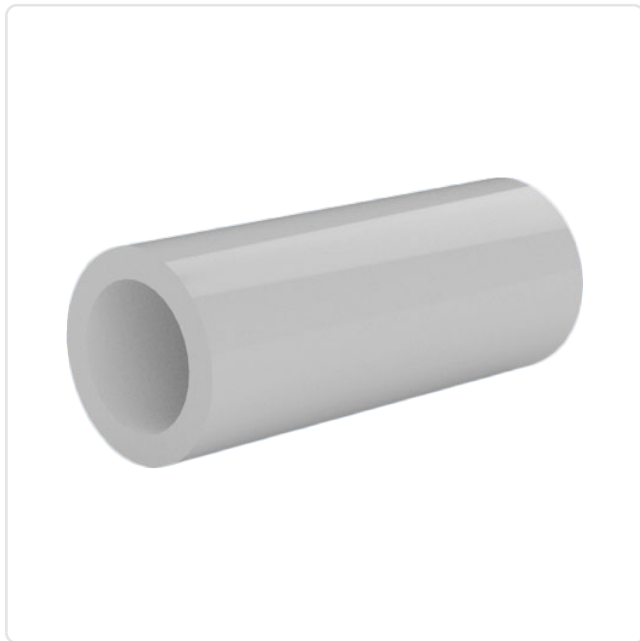
Abbildung ggf. ähnlich

Außendurchmesser [mm]: 4 Brennbarkeitsklasse: UL94-V2 Farbe: weiß Für Gewinde: M1 Innendurchmesser [mm]: 1.2 Länge [mm]: 24 Material: PA 6.0 Materialgruppe: Kunststoff Gewicht: 0.33g Konformitäten: