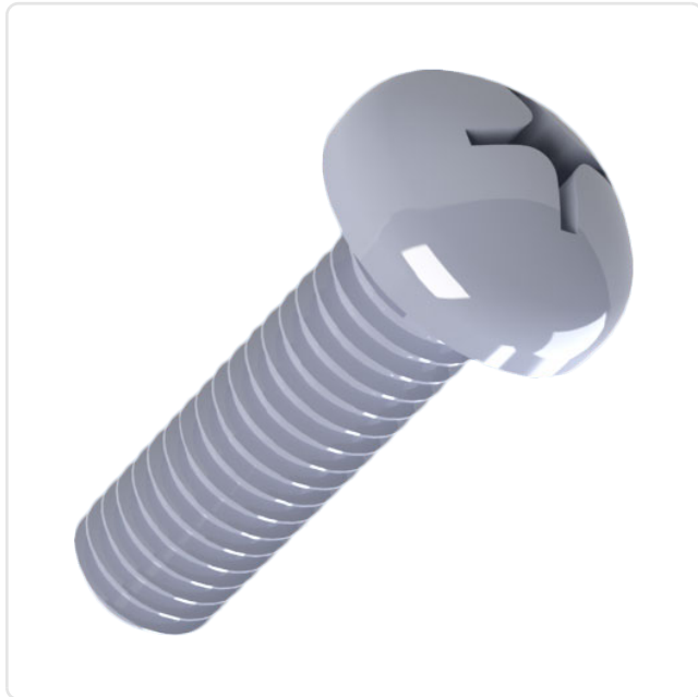
Abbildung ggf. ähnlich