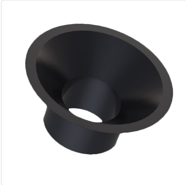
Abbildung ggf. ähnlich