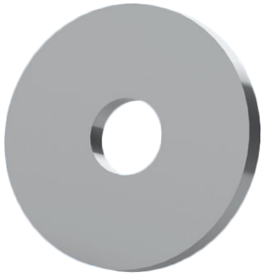
Abbildung ggf. ähnlich