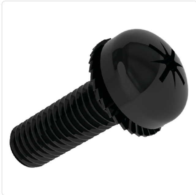
Abbildung ggf. ähnlich