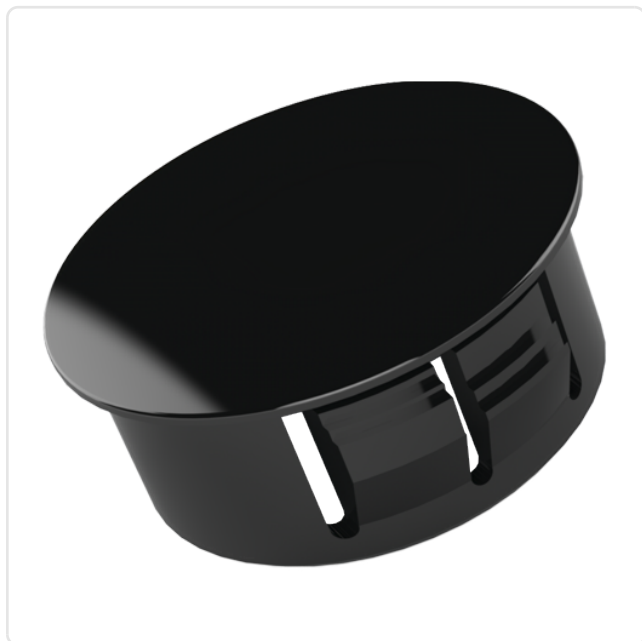
Abbildung ggf. ähnlich