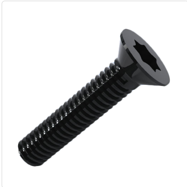
Abbildung ggf. ähnlich